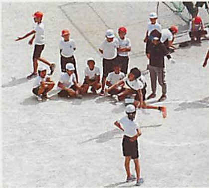
もっと行けェ〜・・・ソフトボール投げ

低学年の「立ち幅跳び」と高学年の「握力」「20mシャトルラン」は、後日学年ごとに行います。