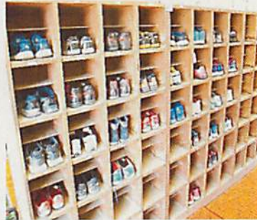
くつも整えて・・・