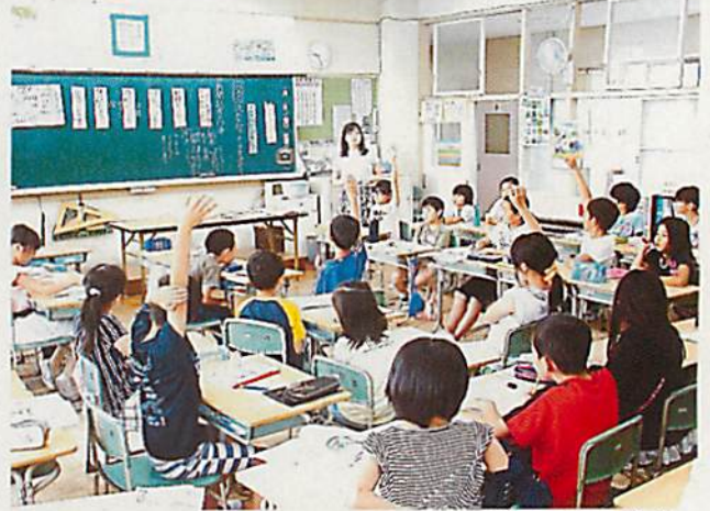
みんな集中しています ・・・4年生国語の授業

運動会を終え、もうすぐ2週間がたちます。くつやかぼん、自分の持ち物の整理整頓、人の話を最後まで聞く、落ち着いて学習に取り組む等、日常の当たり前のことや目立たないことを大切にしたいと思います。